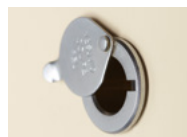
MIRILLA CLÁSICA Cromada o latón