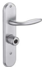
MANILLA Acabado cromado o latón pulido